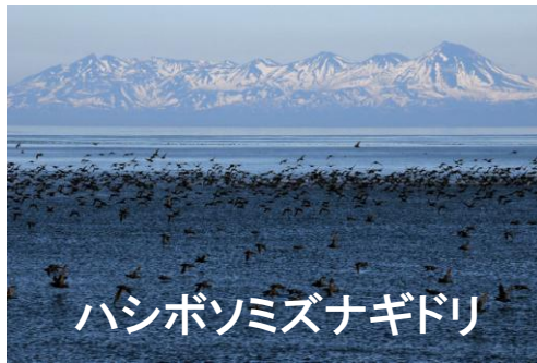
ハシボソミズナギドリ